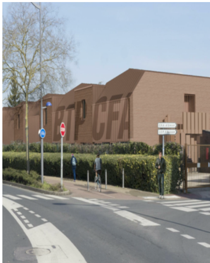
Futur façade du CFA