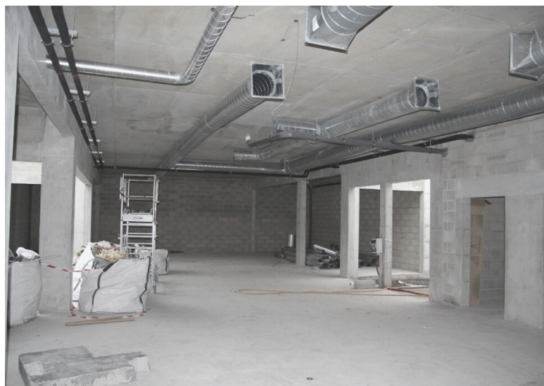
Futur atelier électricité

BTP CFA Ermont affiche clairement son ambition : demain, il deviendra un véritable pôle d'excellence voué, notamment, au domaine de l'électricité avec la conception de nouveaux ateliers. Le CFA sera alors, à même, d'apporter une réponse adaptée aux attentes de toutes les entreprises du bâtiment avec des équipements et des plateaux techniques à la pointe de la modernité. Il sera également capable de répondre aux attentes et aux besoins des jeunes et de leurs familles.